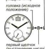
первый щелчок (выставление числа)