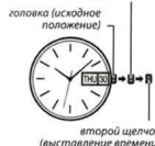
второй щелчок (выставление времени)