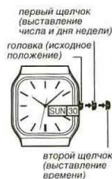
первый щелчок (выставление числа и дня недели)