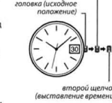
второй щелчок (выставление времени)