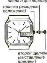
второй щелчок (выставление времени)