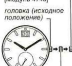
головка (исходное положение)