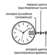
второй щелчок (выставление времени)