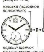
первый щелчок (выставление числа)