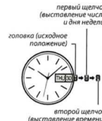
второй щелчок (выставление времени)