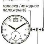
первый щелчок (выставление числа)