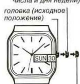
головка (исходное положение) / второй щелчок (выставление времени)