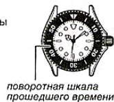
поворотная шкала прошедшего времени