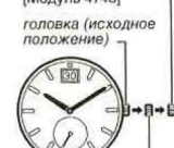
первый щелчок (выставление числа)