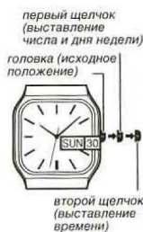
первый щелчок (выставление числа и дня недели)