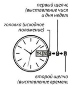
первый щелчок (выставление числа и дня недели)