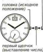
первый щелчок (выставление числа)