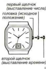
первый щелчок (выставление числа)