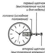
первый щелчок (выставление числа и дня недели)